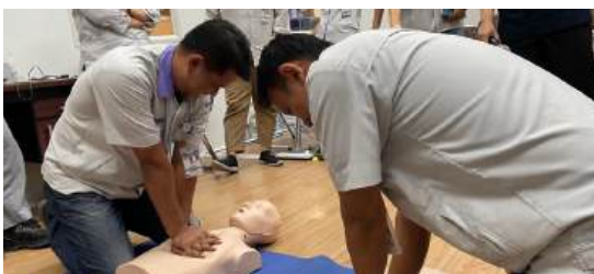
Praktik pelaksanaan RJP

Kesuksesan dalam pertolongan pasien henti jantung memerlukan pengetahuan dan kemampuan terkait RJP. Untuk itu dari Komite Kesehatan dan P3K PT Yamaha Musical Products Asia (YMPA) bekerja sama dengan klinik Westerindo yang merupakan In House Klinik di YMPA mengadakan training terkait RJP. Kegiatan training dilaksanakan sebanyak 2 kali, training yang pertama dilaksanakan pada 27 Maret 2024 dengan peserta dari komite kesehatan dan P3K dan perwakilan setiap bagian. Pelaksanaan training yang kedua pada tanggal 19 Juni 2024 dengan peserta dari manajemen.