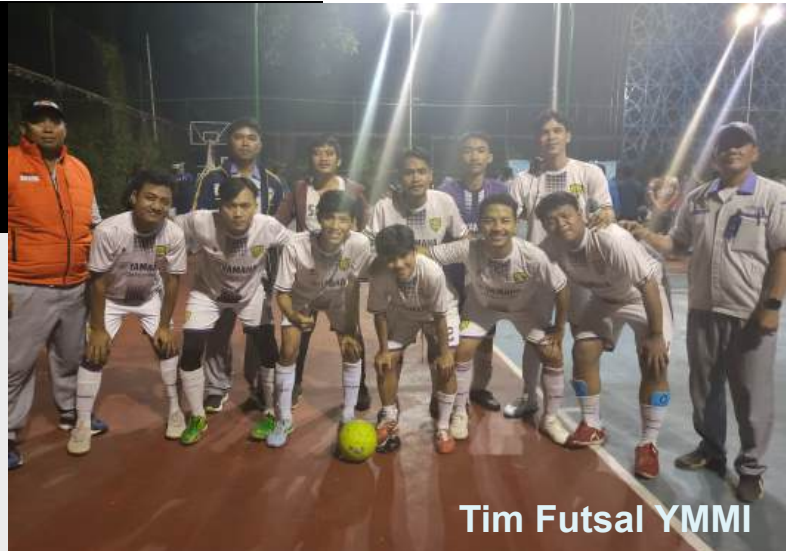
Tim Futsal YMMI

Dalam rangka meningkatkan motivasi kerja, hubungan antar karyawan, juga untuk menjaga kesehatan dan menyalurkan hobi para pekerja, Perusahaan memperhatikan dan memberikan bantuan untuk kegiatan olahraga yang diminati oleh karyawan, seperti: Sepak Bola, Futsal, Badminton, Tenis Meja, Volley dan Basket. Perusahaan menyakini bahwa olahraga bukan hanya sekedar aktivitas fisik, tetapi juga sebuah arena di mana disiplin, strategi, dan semangat juang bertemu untuk mencapai kemenangan.