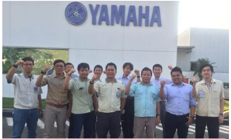
Member awal group TAPC

Touan Asia Procurement Control Group (Selanjutnya disingkat TAPC) adalah grup yang beranggotakan perwakilan 6 basis produksi di Indonesia dan 1 basis produksi di Malaysia (Observer) yang berfungsi untuk melakukan kegiatan perencanaan ( planning ), kontrol ( controlling ) dan pembuatan infrastruktur / standarisasi untuk mempermudah proses pekerjaan di masing-masing basis produksi. Grup ini dibentuk pertama kali di Yamaha Corporation Japan (YC) dan dilakukan kick off pada bulan Juli 2016 oleh Mr. Koji Akai di PT. Yamaha Music Manufacturing Asia (YMMA).