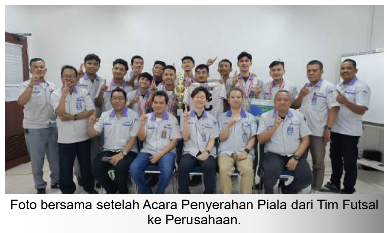
Foto bersama setelah Acara Penyerahan Piala dari Tim Futsal ke Perusahaan.

Sebagai bentuk apresiasi, tim Futsal YMMI diberikan kesempatan untuk makan siang bersama dengan direksi. Direksi mengucapkan selamat atas pencapaian Tim Futsal pada POR JIEP tahun ini, semoga dengan disiplin dan semangat yang sama dapat membawa Perusahaan lebih baik kedepannya. Salam sportifitas!. (RA/YMMI).