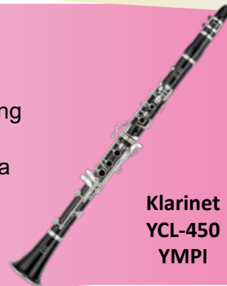
Klarinet YCL-450 YMPI