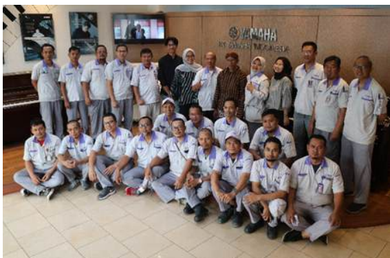
Farewell salah satu karyawan bagian Painting

Bagaimana menyeimbangkan kewajiban bekerja dan berorganisasi ?