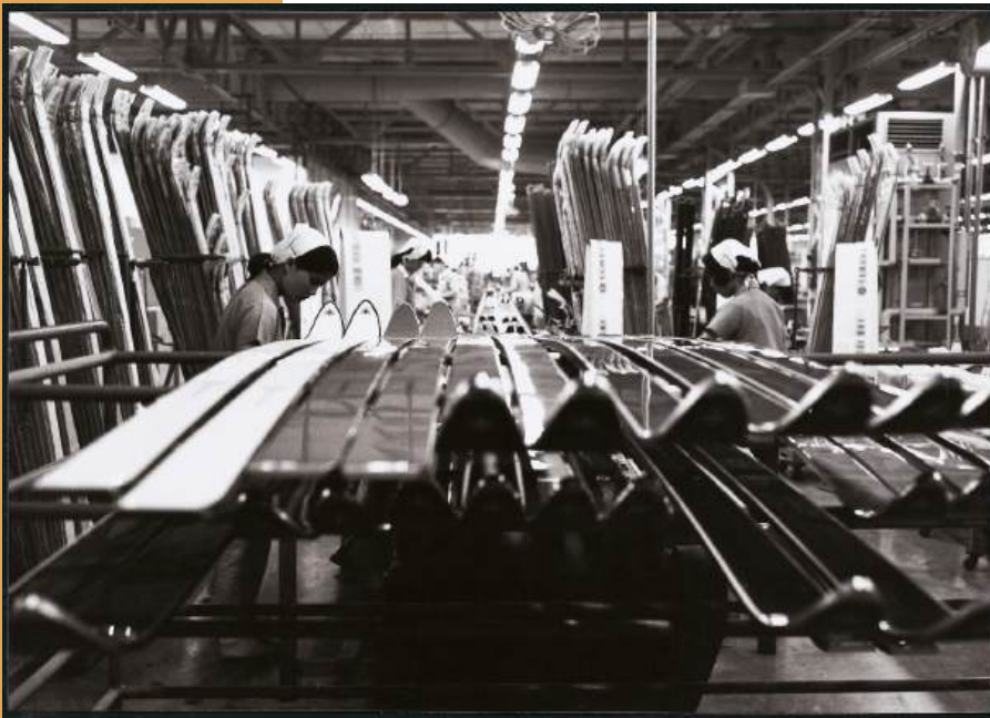
Proses produksi papan ski kelas atas tahun 1970