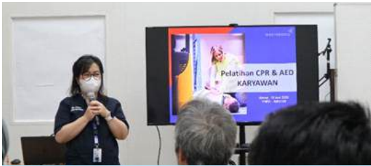
Trainer pelatihan RJP

Henti jantung merupakan salah satu kondisi gawat darurat yang dapat menyebabkan kematian jika tidak ditangani dengan tepat. Kasus henti jantung dapat terjadi dimana saja dan kapan saja, termasuk di area kerja. Salah satu upaya dalam meningkatkan harapan hidup korban yang mengalami henti jantung adalah dengan memberikan tindakan Resusitasi Jantung Paru (RJP). Tindakan RJP dilakukan untuk membantu mengembalikan kemampuan pompa jantung dan memperbaiki sirkulasi darah dalam tubuh.