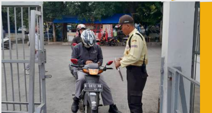
Pemeriksaan kelengkapan surat kendaraan