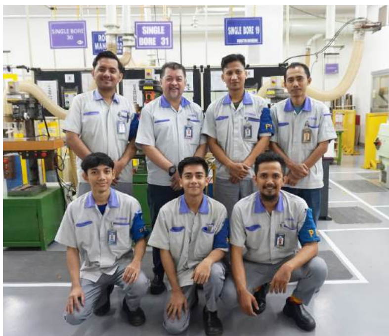
Member PE JIG