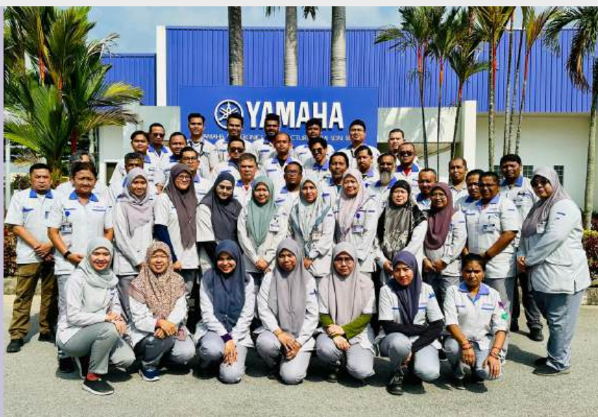
ENG/QA - PROCESS ENG