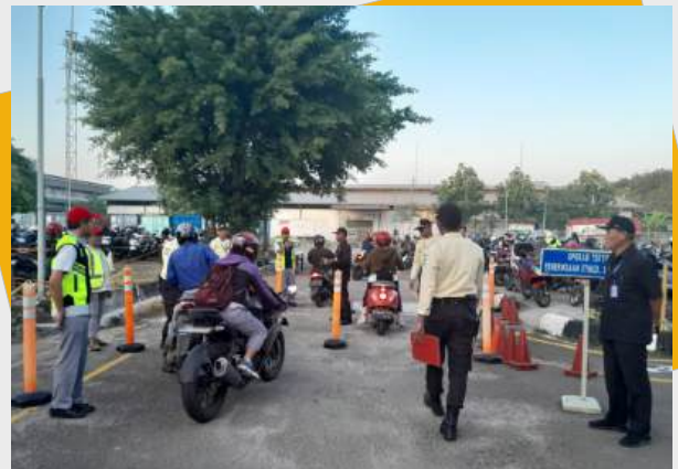
Kondisi antrian saat Patrol