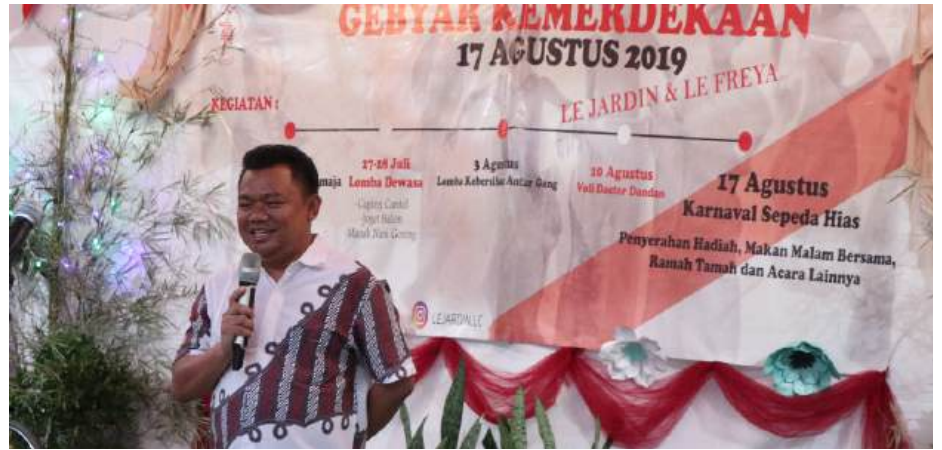
Membuka acara HUT RI

”Berorganisasi menurut saya adalah aktualisasi diri saya untuk masyarakat”