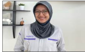
Nadea A. N (YMPA) Sub Responsible Editor