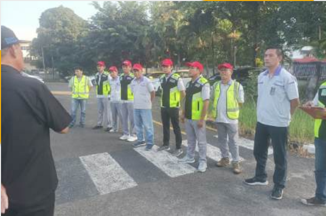
Brifing persiapan menjelang Patrol

Patrol lalu lintas adalah salah satu kegiatan dan program dari Secretariat dan Komite K3 di PT. Yamaha Indonesia untuk menertibkan para karyawan mengenai dokumen-dokumen berkendara dan patuh terhadap aturan berkendara di jalan raya. Kegiatan ini rutin diadakan tiga bulan sekali dengan melibatkan para Manager, Komite Lalu Lintas dan PUK SPSI serta para anggota Security. Patrol diadakan pada plan Rawagelam dan Pulokambing. (RCR/YI).