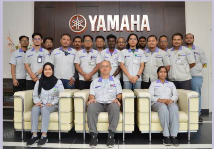
ENG/QA - INDUSTRIAL ENG

Industrial Engineering memberi tumpuan kepada mengoptimalkan sistem, proses dan organisasi yang kompleks untuk memaksimumkan kecekapan dan produktiviti. Bahagian ini menggunakan prinsip kejuruteraan dan teknik analisis untuk meningkatkan prestasi operasi merentas pelbagai industri.