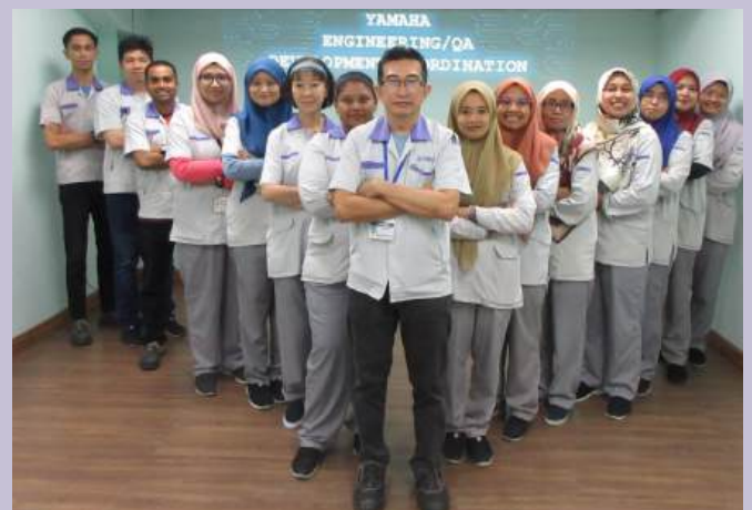
ENG/QA - DEVELOPMENT COORDINATION

Workguide: Mereka bentuk panduan kerja baru untuk produk baru.