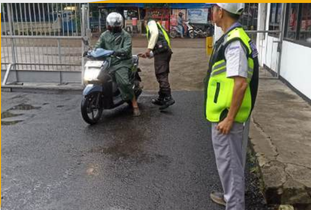
Pemeriksaan kondisi belakang kendaraan