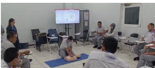
Praktik pelaksanaan RJP

Materi yang diajarkan training tersebut mulai dari penjelasan singkat sistem peredaran darah dan sistem pernafasan, cara mengenali kejadian henti jantung, cara melakukan kompresi dada dan bantuan pernafasan dengan benar, hingga posisi recovery jika nafas dan nadi sudah kembali. Selain itu para peserta juga diminta untuk praktek RJP secara langsung dengan menggunakan alat peraga.