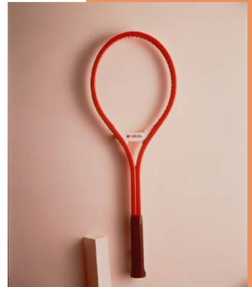
Raket Tenis YFG-30

Dengan meluncurkan tongkat golf komposit karbon pertama di dunia, Perusahaan memukau pasar dan menunjukkan tingkat kemampuan teknologinya. Selanjutnya dengan mengikuti teori desain dan kinerja biaya dengan tujuan mengembangkan produk unik untuk mengimbangi inovasi yang terus-menerus, produk Yamaha juga digunakan oleh pemain kelas dunia. Hal ini menghasilkan penampilan olahraga yang cemerlang dan Nippon Gakki membangun posisi yang kuat di bidang peralatan olahraga. (Majalah World Symphonia - No.19 June 2013)