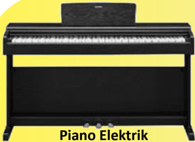
Piano Elektrik YDP-145B YMMA

Bagian Quality Assurance Alat Musik dan Bagian Quality Assurance Audio dari Unit Bisnis Alat Musik dan Audio menyampaikan suara konsumen dari seluruh dunia yang menggunakan produk Yamaha yang dibuat di pabrik Anda.