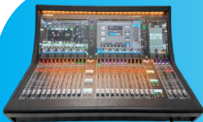
Digital Mixing Console DM7/DM7C YEM