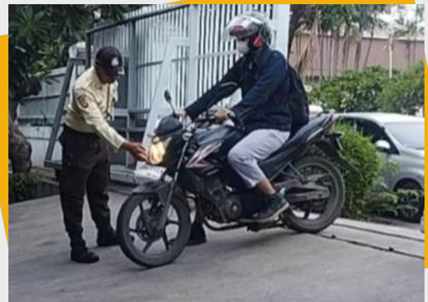
Pemeriksaan kondisi depan kendaraan