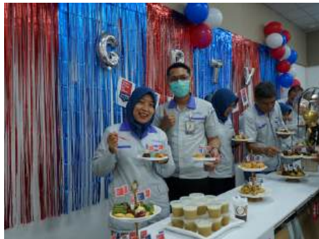
Hidangan spesial untuk karyawan saat rehat Coffe Break dan makan siang.

Untuk mendapatkan sertifikasi tersebut diperlukan kerja sama penuh dari setiap karyawan. Setelah sertifikasi dikonfirmasi, perusahaan memutuskan untuk mengadakan perayaan sebagai bentuk ucapan terima kasih, berupa suguhan spesial bagi karyawan kantor saat Coffee Break , dan menu tambahan khusus saat makan siang untuk seluruh karyawan.